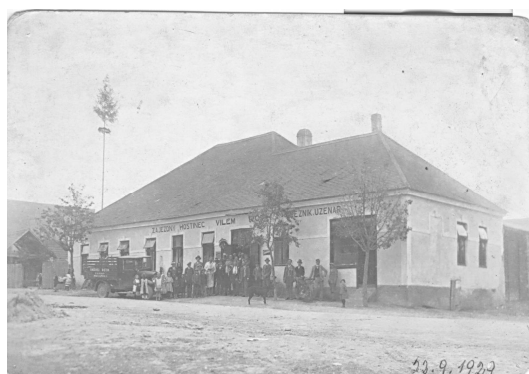
Na snímku "Borkova hospoda" v r. 1929 Pokračování v dalším čísle Zpravodaje. Zdeněk Adámek, kronikář

V r. 2009 byla zahájena komplexní přestavba celé budovy, která byla ukončena v závěru roku 2011. 25. prosince byl po náročných úpravách budovy č.p. 120 otevřen v těchto prostorách Music Club Boomerang.